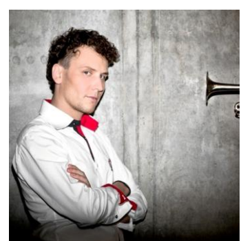
トランペット:ルカス・ゴットシャルク Lukasz Gothszalk

ルカス・ゴットシャルクは、同世代の中でも卓越した能力のある音楽家の一人で、これまでにカールスルーエ音楽大学、アムステルダム音楽院、マンハッタン音楽院、ハンズ・アイスラー音楽大学ベルリンにて学ぶ。国際トランペットギルド主催のエルスワース・スミス国際トランペットコンクール(ボストン)第1位、日本管打楽器音楽コンクール第1位、ルクセンブルク青少年国際音楽コンクール第1位などを初めとする、数々の有名国際コンクールで入賞。ゴットシャルクのキャリアにおいて現代曲は重要な部分を占めており、ジェルジュ・リゲティ、ベルト・アロイス・ツィンマーマン、ルチアーノ・ベリオーら作曲家の要求する超絶技巧をこなす事が出来る、数少ないソリストの一人である。