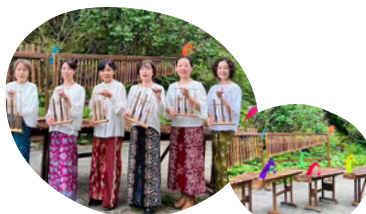
Plumeria インドネシア民族楽器アンクルン