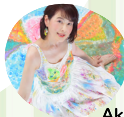
Akimuse ピアノ演奏に合わせて 竹の音を奏でよう!