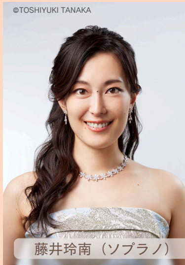
藤井玲南 (ソプラノ)