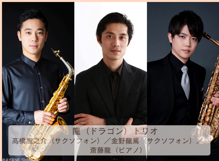
龍(ドラゴン)トリオ

開演：15時30分 (開場14時45分) 全席自由 ￥1,000円 ※未就学児入場不可