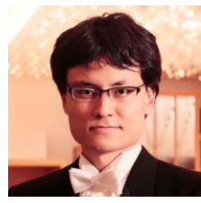
ピアノ:佐竹裕介 Yusuke Satake

1962年にパリ生まれ。81年、19歳でミュンヘン国際音楽コンクールにて優勝。その後ハノーファー音楽大学にてカール・ハインツ・ケマリンクに師事。85年シヨパン国際ピアノコンクール(ワルシャワ)、88年にダブリン国際ピアノコンクール、89年にはルービンシュタイン国際ピアノコンクール(テルアビブ)などの数々のコンクールで入賞している。2012年より現在国際メニューイン音楽アカデミー(コベット、スイス)でマキシム・ヴェンゲーロフ(ヴァイオリン)の公式伴奏者を務める。ベルン芸術大学公式伴奏者。