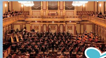
かんげんかく 管弦楽 けい おう ぎ じゅく 慶應義塾ワグネル・ ソサイエティー・オーケストラ